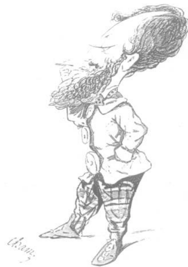
LE MARQUIS D'HERVEY DE SAINT-DENYS

Nogal boud durf ik te beweren dat de invloed van dit werk eerst begint. Inderdaad, wij weten dat het werk van de markies een beperkte verspreiding had en dat er slechts enkele geleerden kennis van hebben kunnen nemen. Dat verklaart tevens de dominante positie van Freud. De moderne onirologen hebben het voordeel dat d'Hervey de weg heeft voorbereid. Maar welke theoretische concepten hebben zij tot nog toe zelf ter berde gebracht? D'Hervey heeft ons nog een hoop te leren.