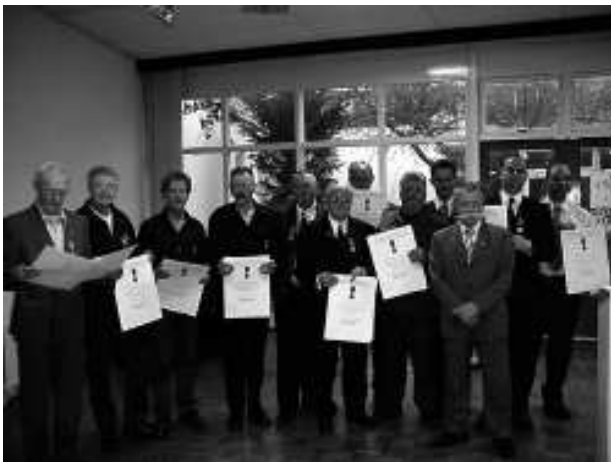
Hulde aan de dames...

Allen van harte gefeliciteerd met deze welverdiende onderscheiding.