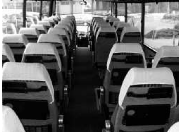
Ook mooi van binnen!