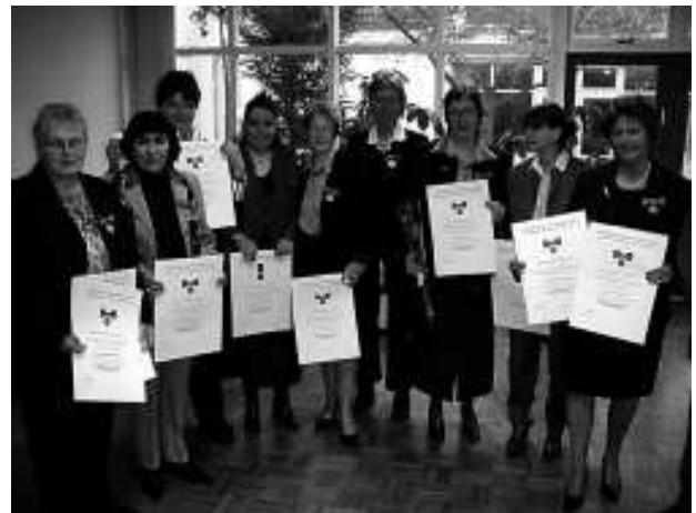
... en aan de heren