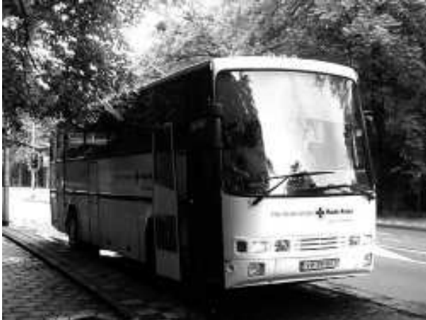
De nieuwe bus...

De volledig gesponsorde bus kon worden aangeschaft dankzij bijdragen van het RABO-Stimuleringsfonds Utrecht, Stichting K.F. Heinfonds, Koninklijke Jaarbeurs Utrecht, Duitse Ridderlijke Orde van Balië en Rotary Utrecht West.