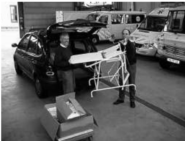
Inladen medisch instrumentarium

Over de inzameling van medische en verpleegkundige goederen voor het St. Francis hospitaal in Katete, Zambia hebben we in 2003 en 2004 al uitvoerig geschreven.