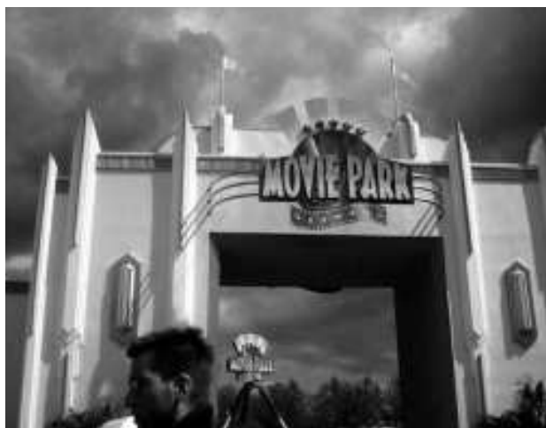
Movie World: mooie shows!

We kwamen na een uurtje of anderhalf rijden aan in Wehl en toen was het: iedereen uit de bus, koffers, tassen en rugzakken pakken en op naar de slaapverblijven. Je sliep met twee á drie mensen op een kamer. Diezelfde middag gingen we een 'nep'-moord oplossen. Erg leuk en moeilijk om er achter te komen wie het had gedaan. De tweede dag moesten we vroeg opstaan, want we gingen naar Movie World in Duitsland. Het was daar enorm groot met hele mooie shows en mooie special effects in de shows. Er was geregeld dat we daar mochten eten en de maaltijd was daar erg lekker. Ik ben helaas een beetje ziek geworden (niet van het eten) diezelfde avond, maar de volgende dag was ik weer prima in orde. We zijn de derde dag lekker naar het zwembad geweest en het was daar wel wat druk maar toch erg leuk en gezellig. Toen zijn we gaan omkleden en de bus weer ingestapt; weer terug naar ons verblijf. Daar hadden we even de tijd om een uurtje te rusten en toen gingen we eten.