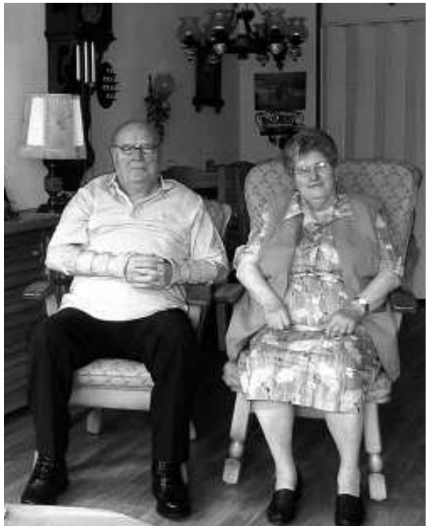
Echtpaar van Deudekom

De Rode-Kruisvakantie week op de J. Henry Dunant werd mede mogelijk gemaakt door de Rabobank in Maarssen.