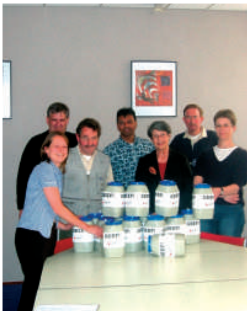
Campagnecomité: klaar voor de start