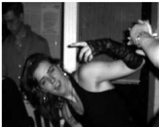
Dansen tot diep in de nacht