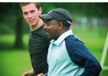
Nieuwe cursus vrienden maken zie pagina 3