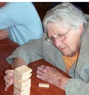
Ontspannen in de Imminkhoeve