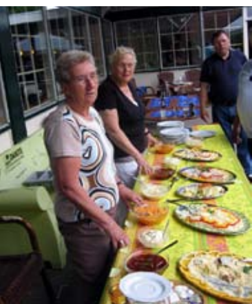
Barbecue in Lemele